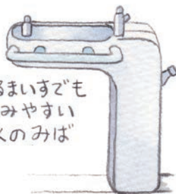
くるまいずでも のみやすい 水のみば