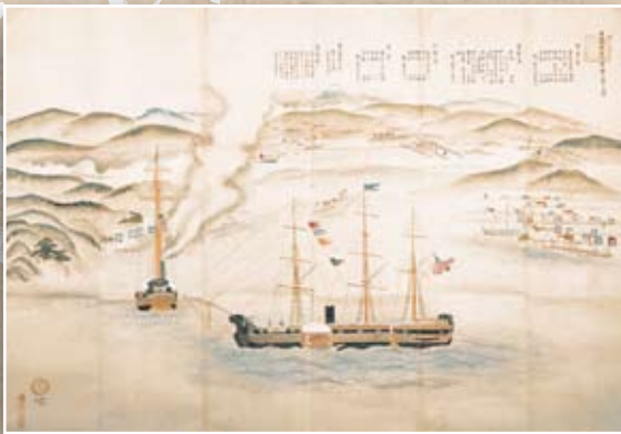
亜墨利加人乗濱上陸之図

10月28日 (先着順。なお、定員を超えた場合は、その時点で締切とさせていただきます。)