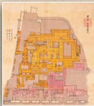
西丸仮御殿向絵図 (重要文化財)