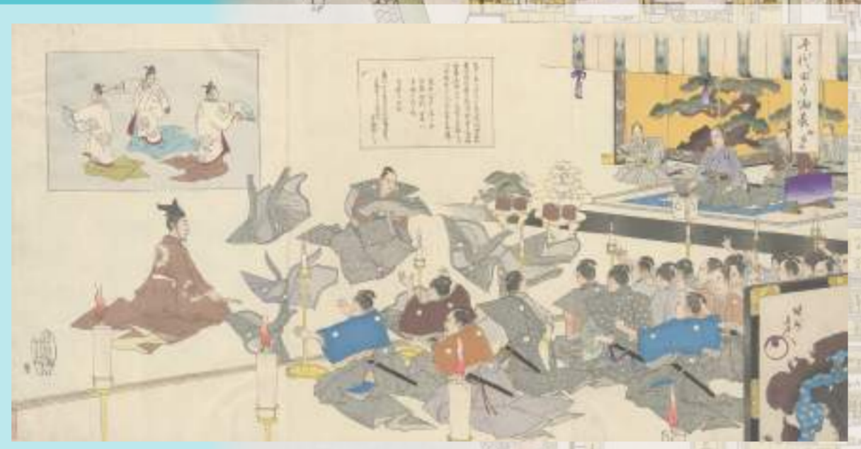
「千代田之御表」「御謡初」

江戸城を住まいとした將軍家。その生活はどのようなものだったのか。將軍の生活の場所であった「中奥」と御台所や奥女中の生活の場所であった「大奥」に焦点を当て、重要文化財の図面や浮世絵等を紹介いたします。