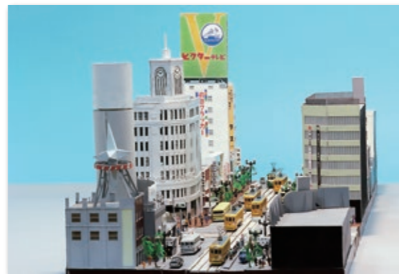
●「GINZA 1964」(制作・所蔵：東京都立大崎高等学校)