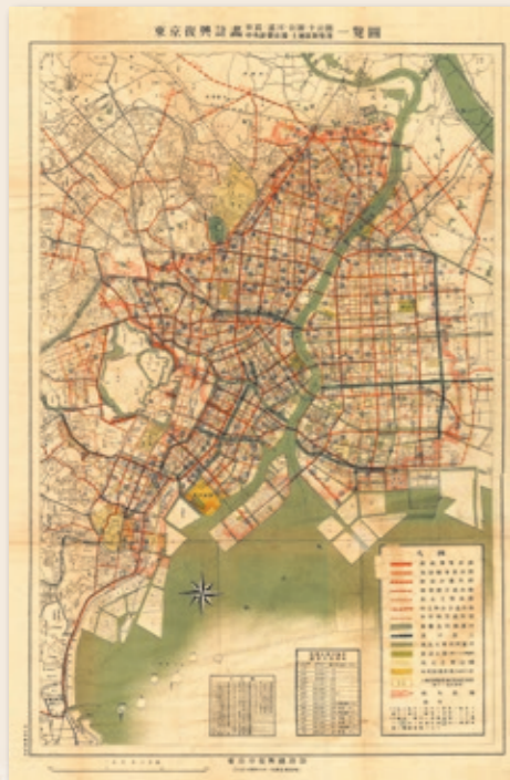
●「東京復興計画 街路・運河・公園・小公園・中央卸売市場・土地区画整理一覧図」 関東大震災からの復興にあたって作成された計画図 『東京市帝都復興事業概要』に所収