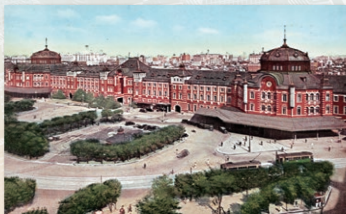
●「帝都の大玄関東京駅の壮観 The Tokyo Station : Railway Center in Japan」 大正3年竣工の東京の表玄関・東京駅 絵はがき『最新大東京』に所収