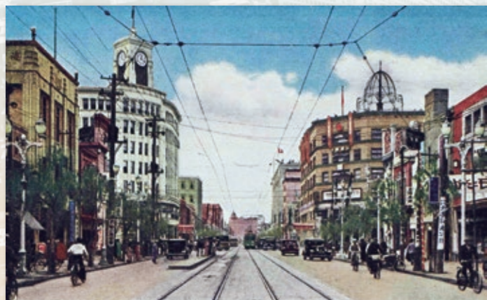
●「銀座大通り」 昭和初期の服部時計店と銀座通り 絵はがき『平和記念東京博覧会絵ハガキ張込帖』に所収