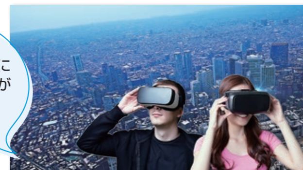
●「REAL 3D MAP TOKYO for VR」(制作：株式会社キャドセンター)