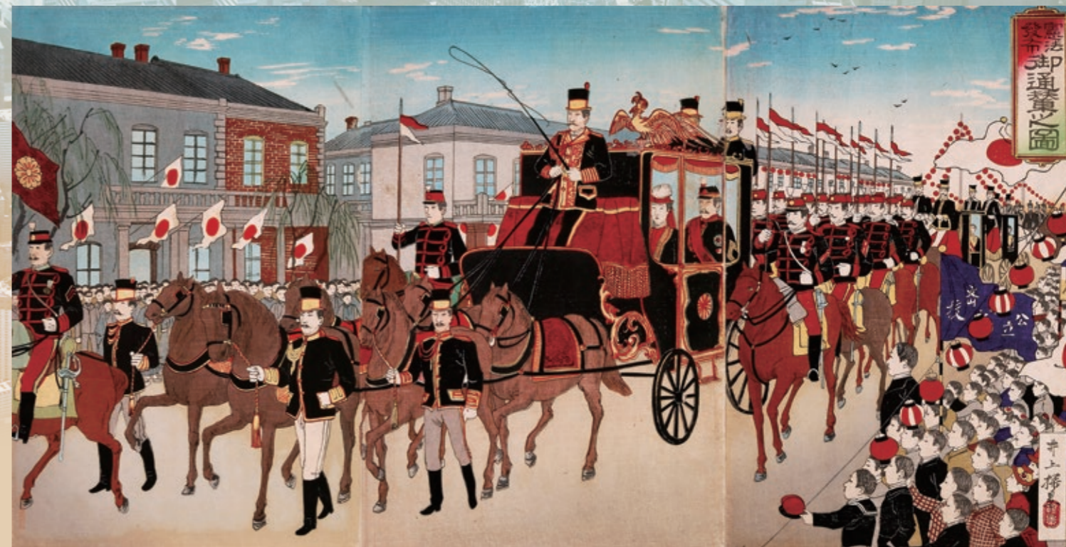
●『憲法発布御通贊之図』(都立中央図書館特別文庫室所蔵) 井上探景 1889 明治宮殿正殿での憲法発布式後、天皇后両陛下が青山練兵場の観兵式に馬車で向かう図