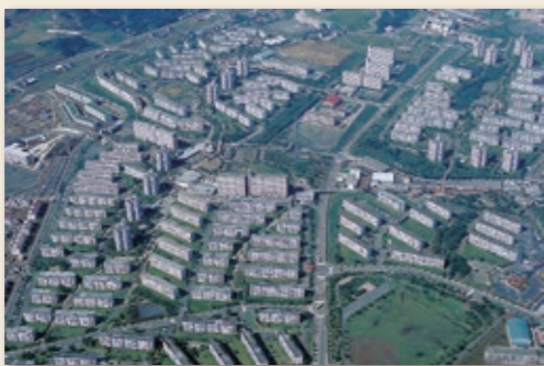
●「多摩ニュータウン(空撮)」 建設が進む多摩ニュータウン