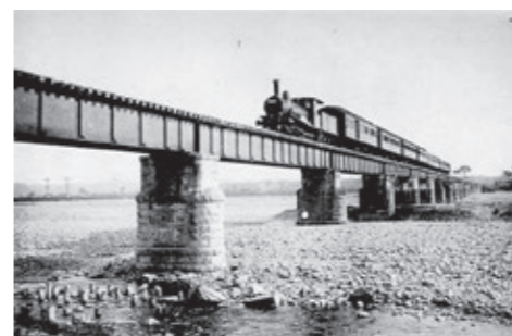
大正時代に多摩川橋梁を渡るSL(中央本線)