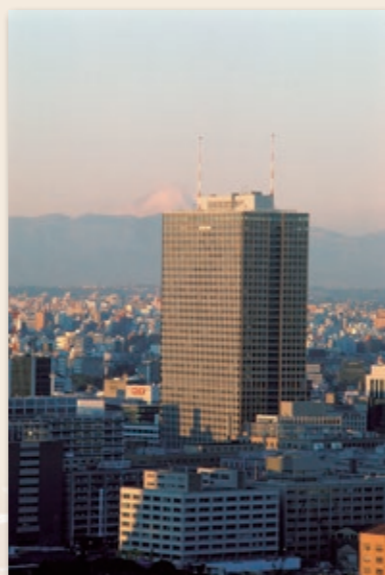
●「霞が関ビルと富士山(空撮)」 日本初の超高層ビル・霞が関ビルディング