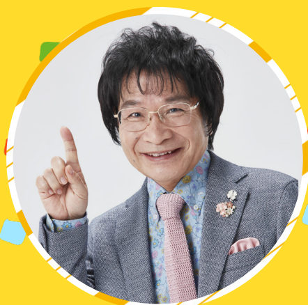
おぎ なおき 尾木直樹さん (都立図書館名誉館長)