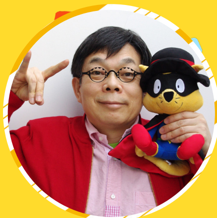
はら 原ゆたかさん (児童書作家)