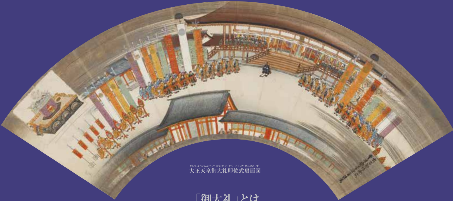
たいしやうてんのうご たいれいそくいしきせんめんず 大正天皇御大礼即位式扇面図

Imperial Accession Rites as depicted in the Kiko Collection