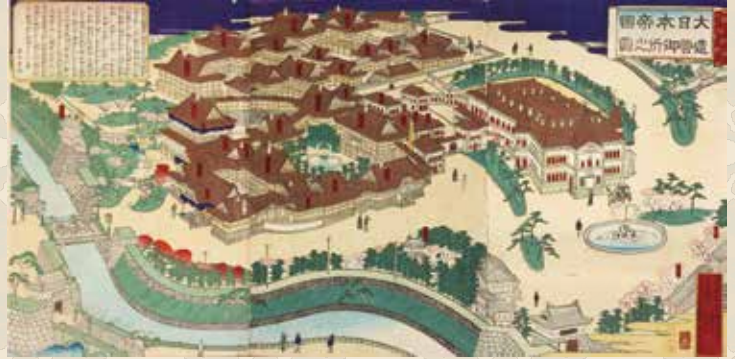
たいにっぽんでいくさうえいごしよのず 大日本帝国造営御所之図