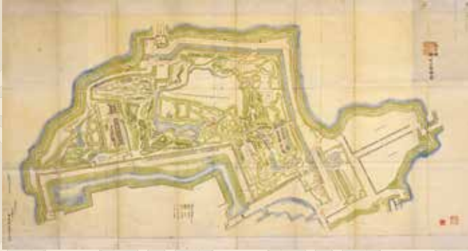
えどおほりきあげそうえず 江戸城御吹上総絵図 (重要文化財)

木子清敬(1845-1907)は、明治天皇の大嘗祭における作事や明治宮殿などの皇室・政府関係の建築物の設計に携わった人物です。木子清敬の功績から明治4年(1871)の大嘗祭と明治宮殿に関する資料を紹介します。