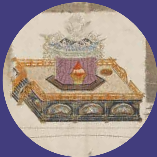
たいしやうてんのうご たいれいそくいしきせんめんず 大正天皇御大礼即位式扇面図(部分)