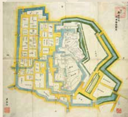
えどごしよないむきうちくるわともそうえず 江戸御城内向内曲輪共総絵図 (重要文化財)