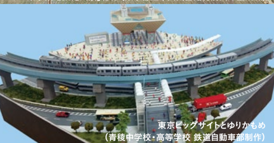
東京ビッグサイトとゆりかもめ (青稜中学校・高等学校 鉄道自動車部制作)