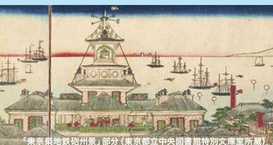
「東京築地鉄砲州景」部分

Tokyo bay area is changing rapidly in preparation for the Tokyo 2020 Olympics and Paralympic Games. In this exhibition, you will see the past, present, and future of the area.