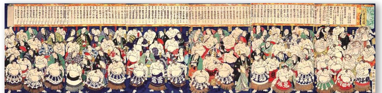
『大日本大相撲勇力関取鏡』(特別文庫所蔵)

江戸時代の世相が描かれた浮世絵の複製(当館特別文庫所蔵)もお楽しみいただけます。