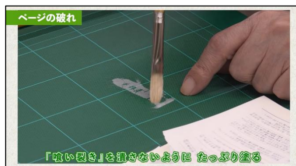
研修動画「 図書館資料の修理（実習動画） 」