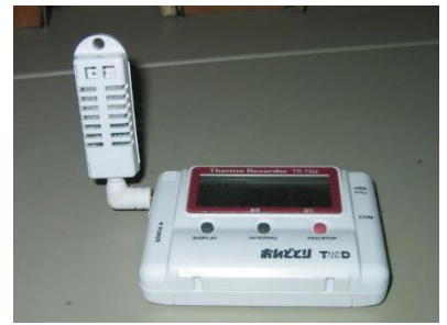
自動温湿度記録装置・データロガー

カビは劣悪な環境では 48 時間で発生すると言われています。以前行った実験の環境では 1 週間程度で発生しました。また、日本の気候環境のなかで完全にカビが発生しない環境を作り出すことは、コスト面など現実的には困難な場合が多くあります。日常的な温湿度の点検と同時に、カビを監視し、発見したらすばやく対処することで、被害を最小限に抑えることも重要です。