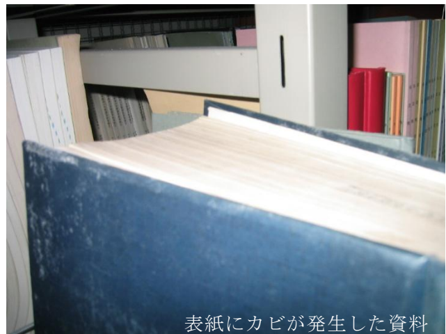
表紙にカビが発生した資料

活性化しているカビは少しの刺激でも胞子を撒き散らします。他の資料への感染を避けるためにも、まずはカビの発生した資料を静かにビニール袋等に入れ、別室に移動させます。移動先の部屋では HEPA あるいは ULPA フィルター付きの空気清浄機を作動させ、カビの除去作業を行います。HEPA あるいは ULPA フィルター付きの空気清浄機や掃除機がない場合は屋外での作業も考えられます。資料の移動が現実的ではない場合は、拡大を抑制するためにエタノールで直ちに処置します。