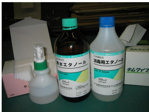
無水エタノールと消毒用エタノール

無水エタノール、消毒用エタノールは薬局で購入できます。500mlで1500円程度です。