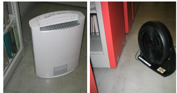
除湿機とサーキュレーター

壁際や書架の最下段など湿気だまりになりそうな箇所には資料はおかないほうがよいでしょう。また除湿機の設置やサーキュレーターなどによる強制的な通風の確保など、対処的であれ、できるだけ環境を改善します。できれば専門業者に依頼して、環境調査を行った上で、施設改善を含めた対策を考えるとよいでしょう。