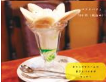
アイスオレ (ハルオウネツさん)

「おすすめはアイスオレで、コーヒーの味がついて いる物を入れています。あとアイスコーヒーはダッ チコーヒーという水出しでコーヒーを抽出させていま す。お客さんに人気なメニューは、「ピザトーストとス ピリタフヤドライカレー」と思える。最近では、20人 くらいのグループでピクニックもやっており、時々 自販機にも乗っているとのこと。