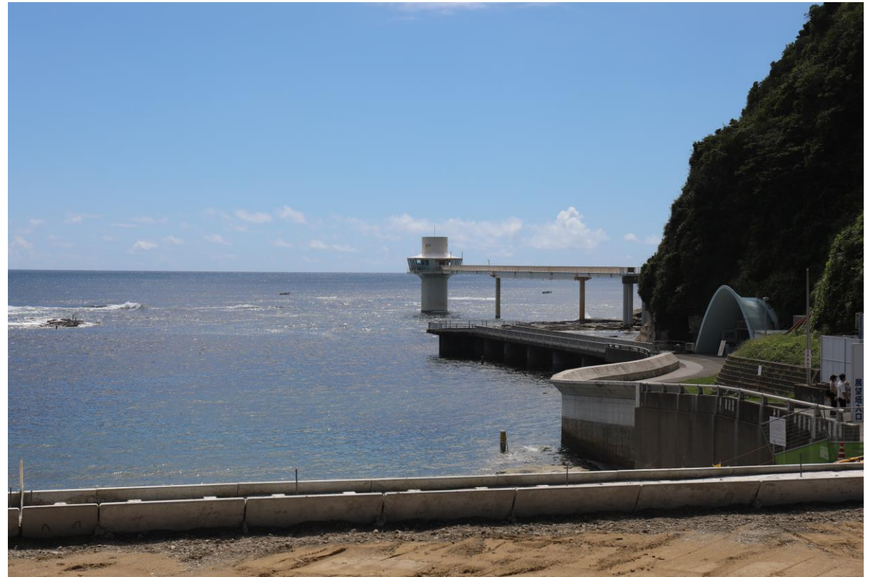
勝浦海中公園海中展望塔